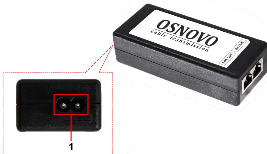
Рис. 3 Midspan-1/300G, Midspan-1/300GA, разъемы задней панели