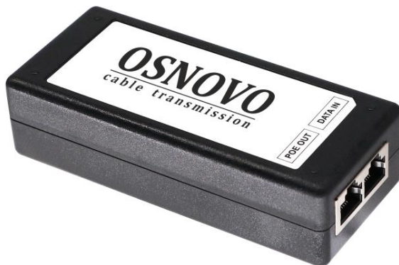
Рис.1 Midspan-1/300G, Midspan-1/300GA, внешний вид