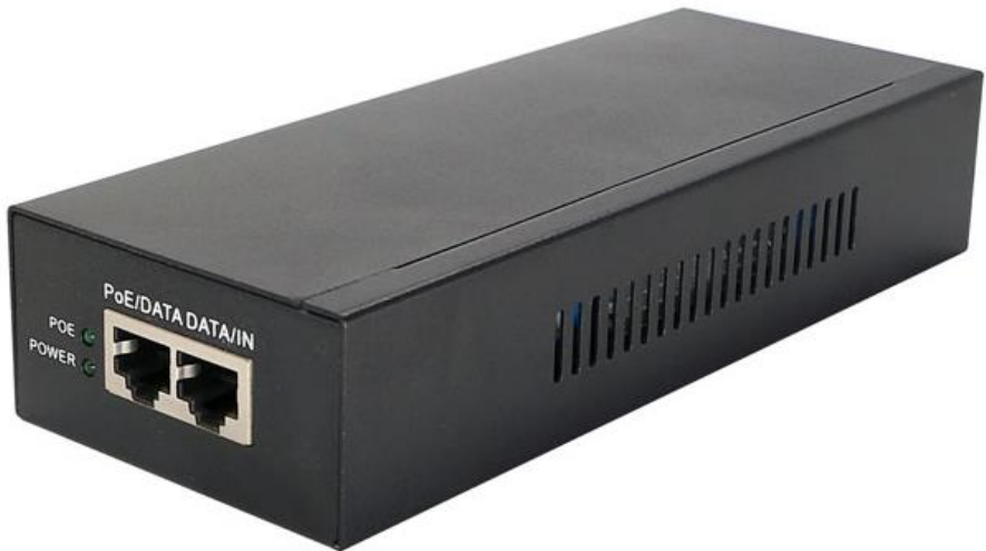
Рис.1 Midspan-1/902G, внешний вид