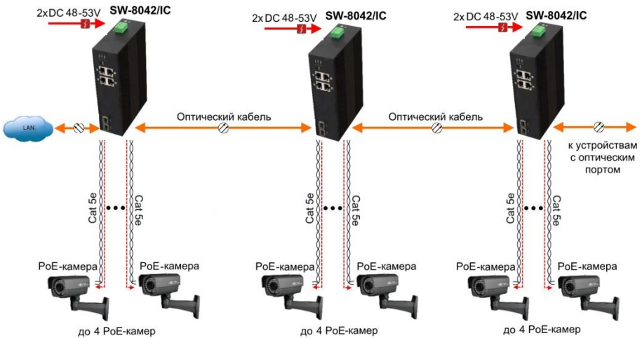
Рис.4 Типовая схема подключения коммутатора SW-8042/IC