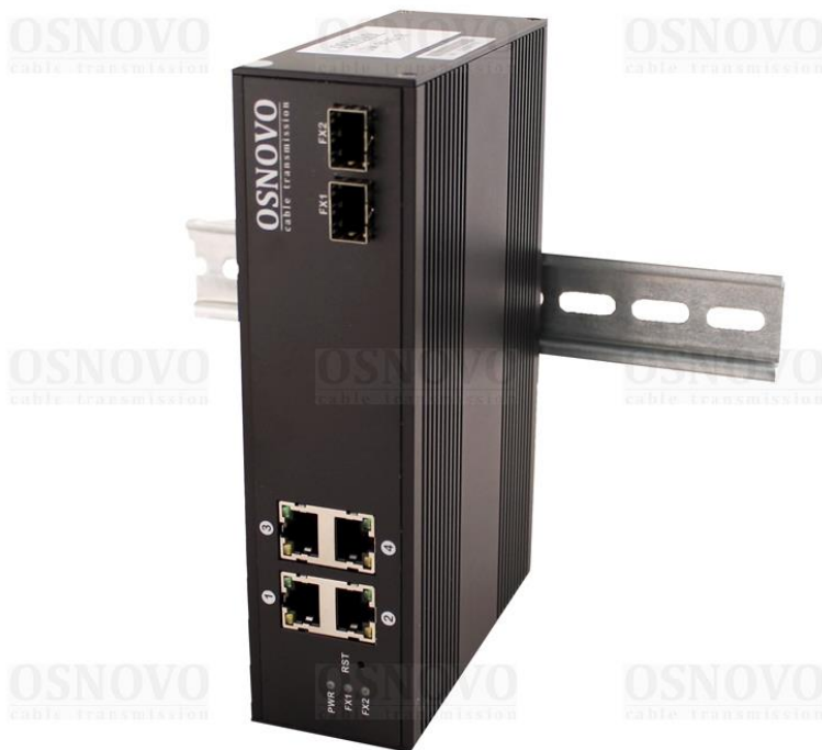
Рис.1 Коммутатор SW-8042/IC, внешний вид