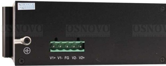
Рис.2 Коммутатор SW-8042/IC, вид спереди/сбоку