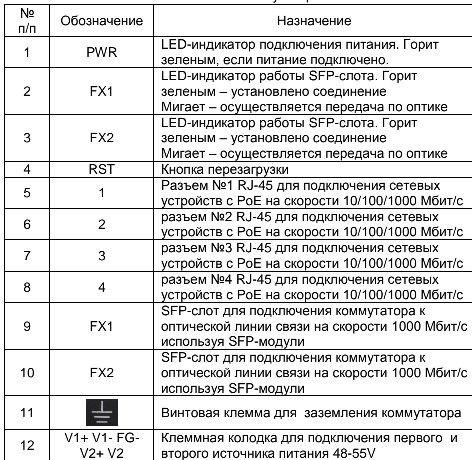
Таб.1 Назначение внешних элементов коммутатора SW-8042/IC