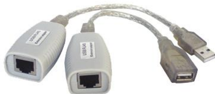
Рис.1 Внешний вид TA-U1/1+RA-U1/1